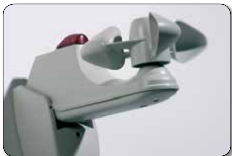
Sol- og vindvakt

Automatisk solskjerming blir en effektiv del av boligens komfortstyring og gir deg en følelse av luksus i hverdagen. Og ikke er det spesielt dyrt heller – driftskostnaden for en automatisk screen er bare noen kroner i året.